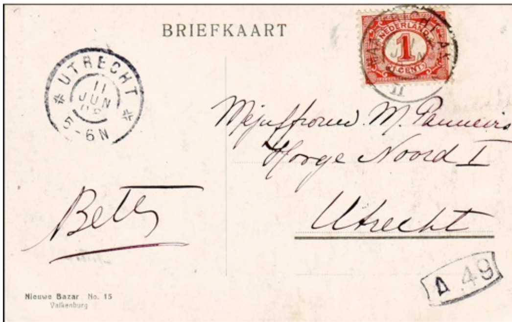
Figure 10. Post card 1908 from Valkenburg to Utrecht with a Grossrundstempel of “MAASTRICHT-AKEN”