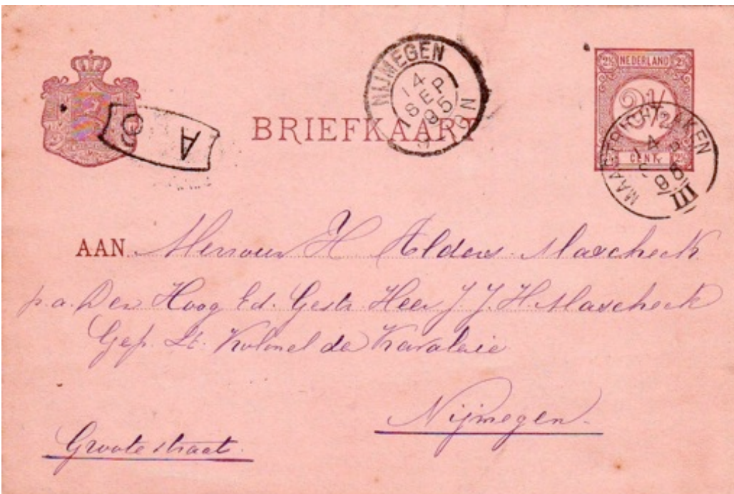
Figure 9. Post card 1895 from Valkenburg to Nijmegen with a Kleinrundstempel of “MAASTRICHT-AKEN”

There is existing both a Kleinrundstempel and a Grossrundstempel from the train “Maastricht-Aken”. Aken is the Dutch name for Aachen.