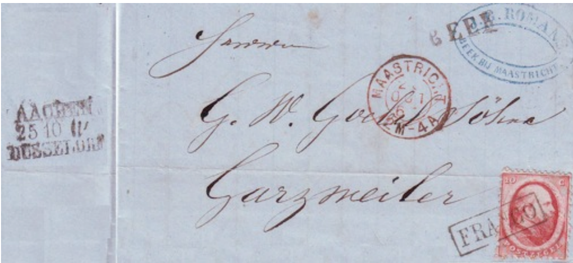
Figure 8. Beek 1867 to Garzweiler (in Prussia) via Maastricht sent in a closed bundle by train from Maastricht to Aachen. Here the bundle was handed over to the rolling post office between Aachen and Düsseldorf as seen from the stempel AACHEN/DÜSSELDORF. The last stretch to the destination was by road.

There is existing both a Kleinrundstempel and a Grossrundstempel from the train “Maastricht-Aken”. Aken is the Dutch name for Aachen.