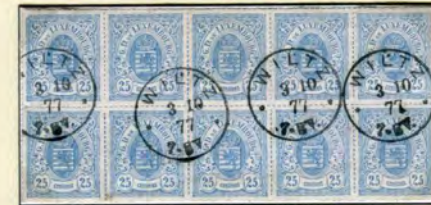
Bloc de dix n° 20 (25 bleu des percés en lignes colorées)

Cachet à date de 23 mm de diamètre, utilisé à partir de 1877. L'indication de l'heure est suivie de la lettre V (Vormittags = matin) ou de la lettre N (Nachmittags = après-midi).