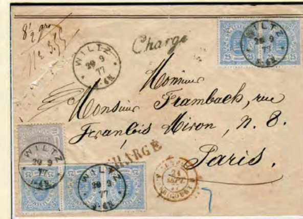
Lettre 20 septembre 1877 de Wiltz à Paris munie de la marque «Chargé» de Wiltz en noir. Affranchissement composé d'une paire et d'une bande de trois n° 20 (25 c bleu) ainsi que d'un n° 30 isolé (10 c gris de l'émission locale) = 1.35 F. La valeur déclarée a dû se situer entre 400 et 500 F: port simple («8½ grs.»): 25 c + taxe de recommandation: 10 c + taxe progressive de 20 c par 100 F (5 x 20): 1 F. Cachets de transit: «Luxemb. Avricourt» et «Chargé» en rouge.

Les lettres à valeur déclarée payaient en outre une taxe d'assurance de 6½ c par 75 F pour l'Allemagne, de 10 c par 100 F pour la Belgique et de 20 c par 100 F pour la France.